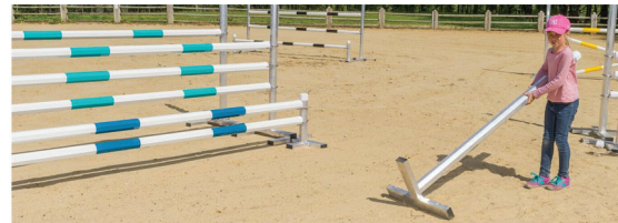
Lissage devant l'obstacle