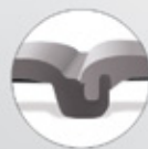
Tapis - Vue de dessus

Sa forme évidée apporte souplesse au tapis et plus de confort à votre cheval.